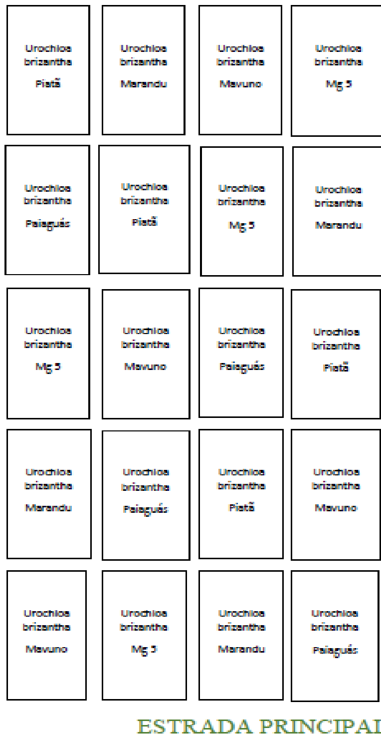
Figura 1. Croqui do experimento de cultivares e híbrido de Urochloa , localizado no Sítio Universitário da UNICEP.

O experimento foi implantado no delineamento em blocos casualizados com quatro repetições, totalizando 20 parcelas, de acordo com o croqui apresentado na Figura 1.