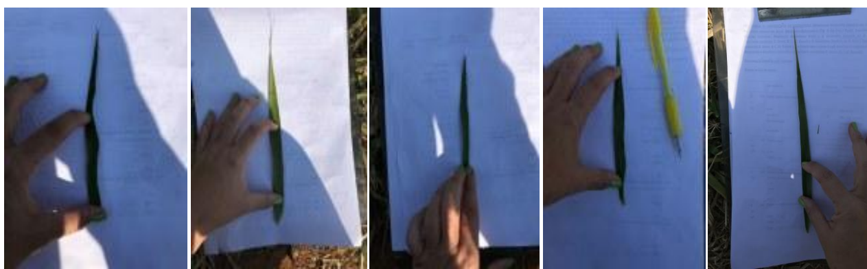
Figura 3. Lâmina Foliar: A) Urochloa híbrida Mavuno; B) U.brizantha cv. Xaraés; C) U.brizantha cv. Marandu; D) U.brizantha cv. Paiaguás; E) U.brizantha cv. Piatã.

A terceira etapa do presente trabalho realizou-se no dia 25 de outubro de 2021. Depois de pouco mais de dois meses as cultivares entraram na fase reprodutiva, sendo possível a análise dos atributos finais. Em visita a área do Sítio Universitário da UNICEP foram analisadas algumas características descritas na tabela de Descritores de Braquiária (Tabela 5) presente nas Instruções para execução dos ensaios de distinguibilidade, homogeneidade e estabilidade de Cultivares de Braquiária do Sistema Nacional de Proteção de Cultivares (MAPA, 2021).